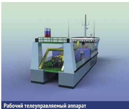
Рабочий телеуправляемый аппарат