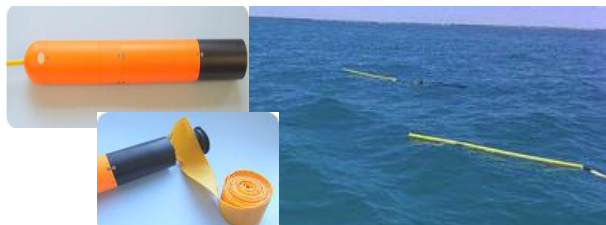
Устройство аварийного всплытия и буй-парашют