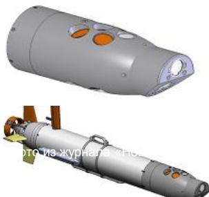
Видеокамеры и антенны DVL (оранжевого цвета).