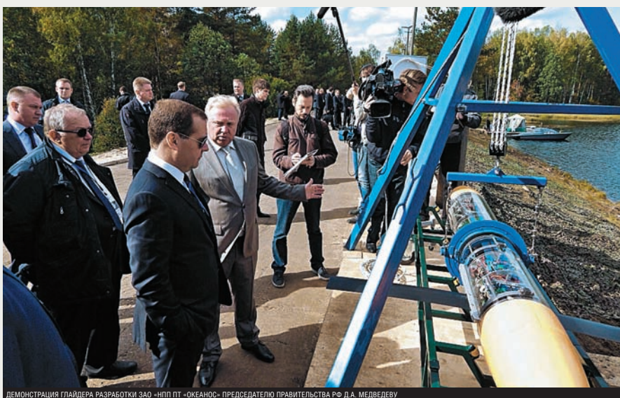
ДЕМОНСТРАЦИЯ ГЛАЙДЕРА РАЗРАБОТКИ ЗАО «НПП ПТ «ОКЕАНОС» ПРЕДСЕДАТЕЛЮ ПРАВИТЕЛЬСТВА РФ Д.А. МЕДВЕДЕВУ

Надводные буй/волновые глайдеры (при работе на чистой воде) являются опорными навигационными точками и ретрансляторами для автономных аппаратов различных типов. Эти механизмы ведут наблюдение за подводной и надводной обстановкой на указанных