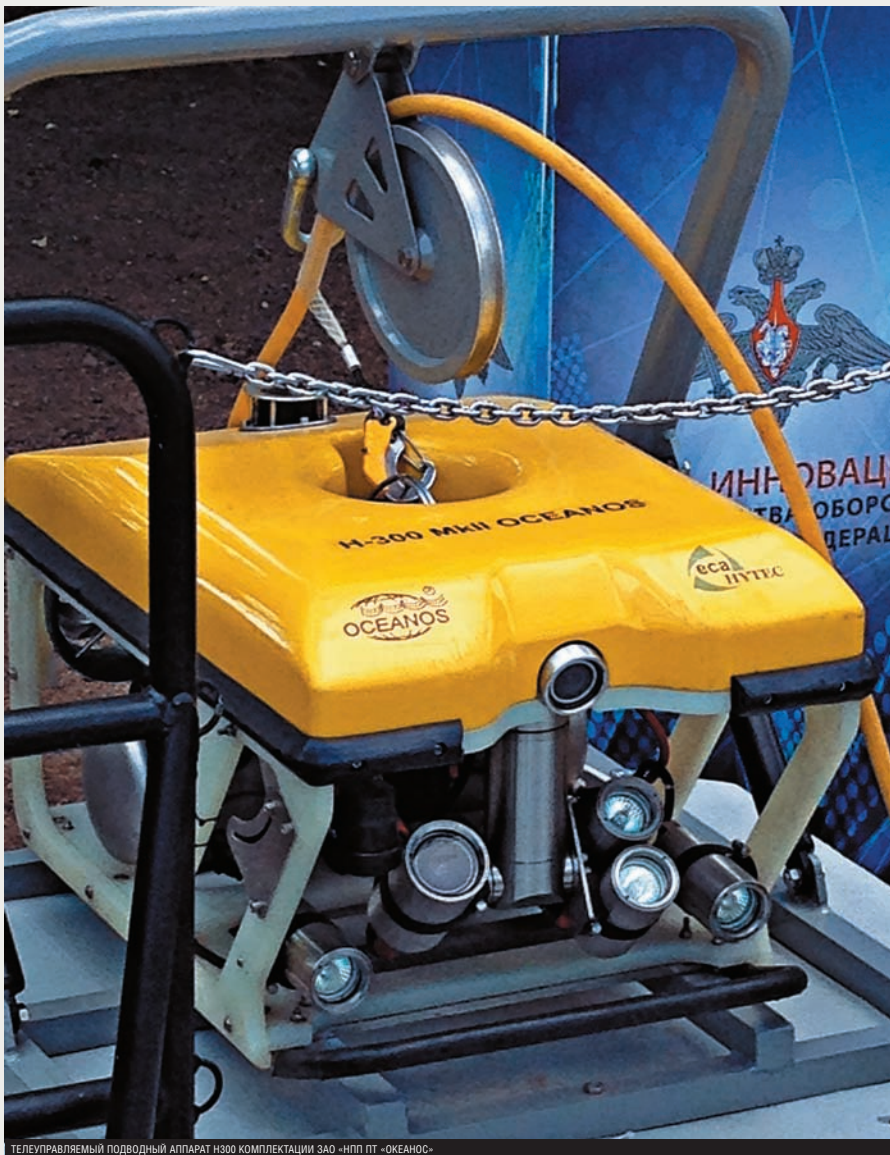
ТЕЛЕУПРАВЛЯЕМЫЙ ПОДВОДНЫЙ АППАРАТ H300 КОМПЛЕКТАЦИИ ЗАО «НПП ПТ «Океанос»

нем случае, средств перехвата небольшой, как правило, скоростной цели.