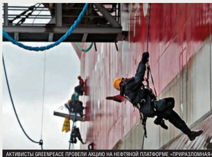
АКТИВИСТЫ GREENPEACE ПРОВЕЛИ АКЦИЮ НА НЕФТЯНОЙ ПЛАТФОРМЕ «ПРИРАЗЛОМНАЯ»

Тем не менее, можно выделить и классифицировать несколько основных элементов.