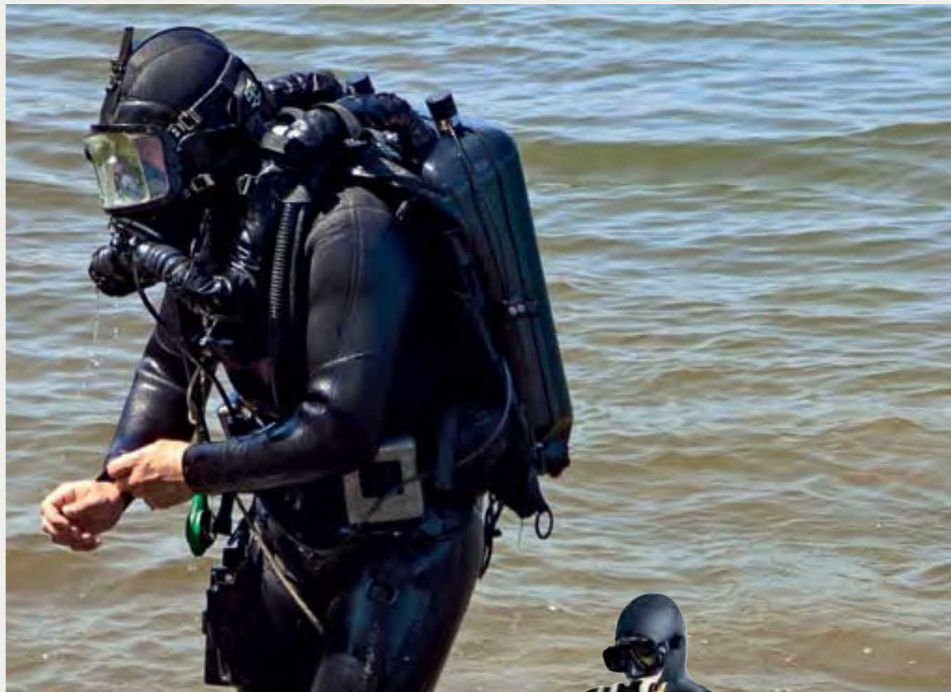
Дыхательный аппарат ДА-21 Mk1