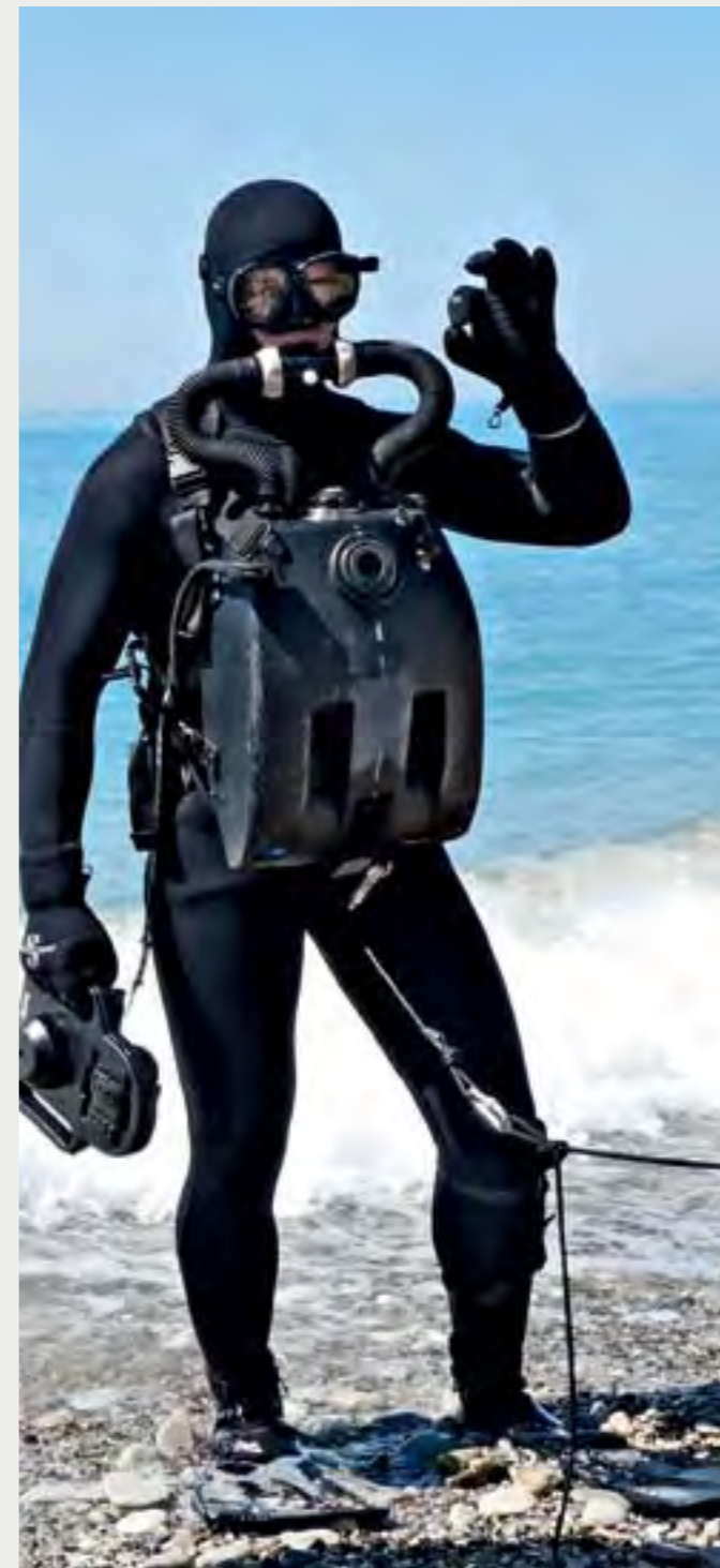
Дыхательный аппарат ДА-21 Мк2

Надо сказать, что дыхательные аппараты ДА-21 (ДА-21М) поколения 1+ и тем более второго поколения получились более функциональными, чем аппараты первого серийного выпуска (2009). Это позволило во время планового обслуживания в подразделениях ВМФ дыхательных аппаратов ДА-21 (ДА-21М) первых выпусков производить их доработку до уровня поколения 1+. Эта работа еще не закончена и будет продолжаться по мере подхода уже выпущенных дыхательных аппаратов ДА-21 (ДА-21М) к сроку технического обслуживания.