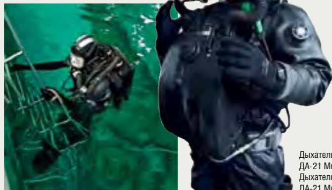
Дыхательный аппарат ДА-21 Mk1 (слева) Дыхательный аппарат ДА-21 Mk2 (справа)

используемых ВМФ водолазных дыхательных аппаратов нового российского водолазного дыхательного аппарата ДА-21 Mk2 позволяет говорить о том, что руководство ВМФ очень серьезно относится к вопросу импортозамещения специальной техники. Насколько это своевременно, сами за себя свидетельствуют факты запрещения экспорта в РФ дыхательных аппаратов от лидеров рынка водолазного снаряжения. Так, еще за два года до введения секторальных санкций в отношении РФ, в 2012 году, уполномоченными органами Федеративной Республики Германия были наложены экспортные запреты на поставку данного снаряжения.