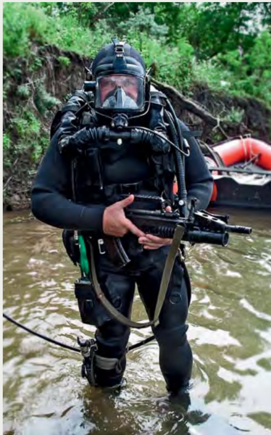
Дыхательный аппарат ДА-21

Все это время дыхательный аппарат ДА-21 эксплуатировался в частях ВМФ одновременно с привычным, но устаревшим снаряжением СЛВИ-71/ВСП с дыхательными аппаратами ИДА-71У/-71П.