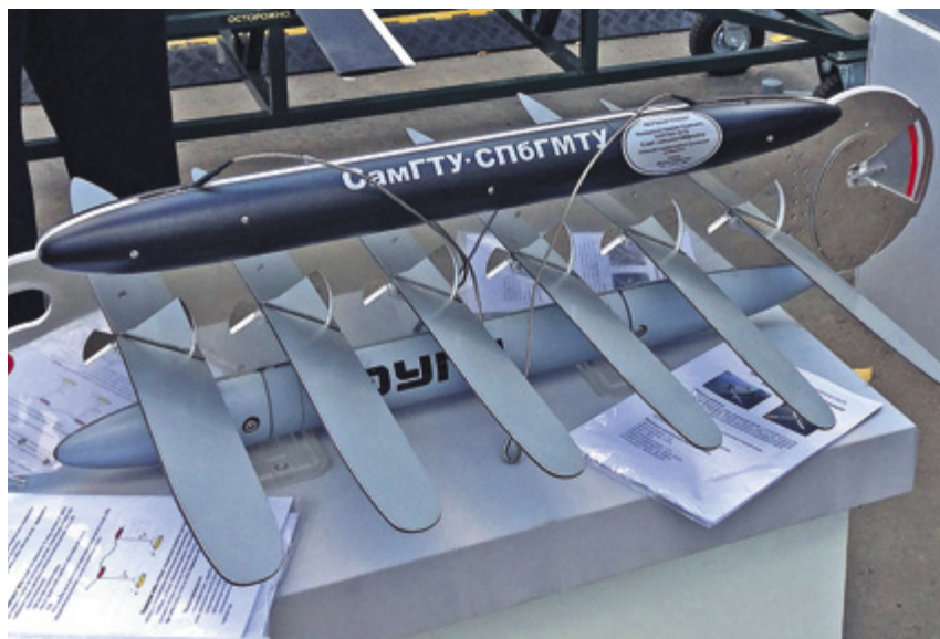
Подводный модуль опытного образца отечественного волнового глайдера СамГТУ-СПбГМТУ