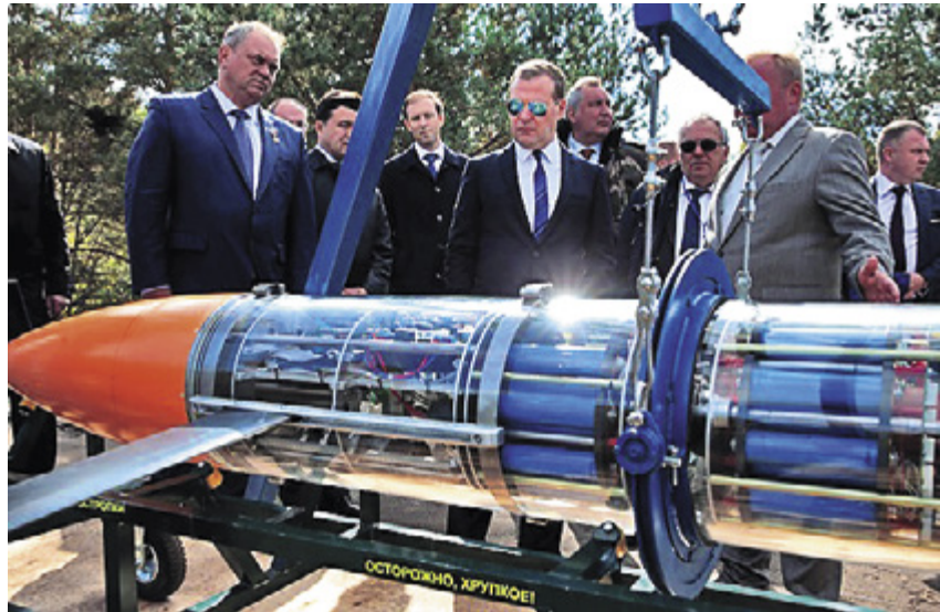
Опытный образец отечественного подводного глайдера торпедной формы второго поколения

Результаты работ по разработкам подводных и волновых глайдеров, проводимых под научным управлением СПбГМТУ, дают основание утверждать, что создание высокоэф-