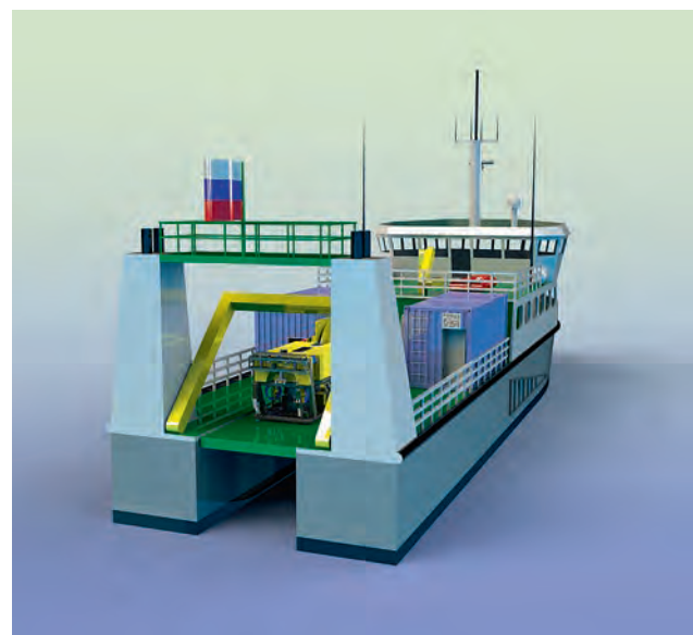
Рабочий телеуправляемый аппарат