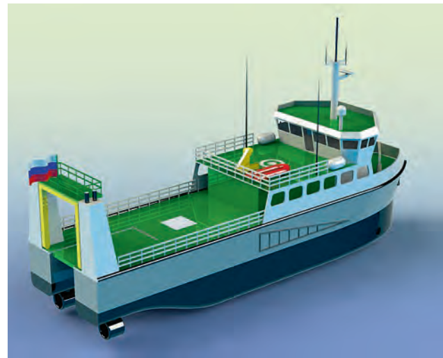
Многофункциональное судно-катамаран, общий вид

ВМФ Норвегии также создал серию ударных ракетных катеров катамаранной компоновки. Строительство новых боевых кораблей специально для действий в северных и арктических морях