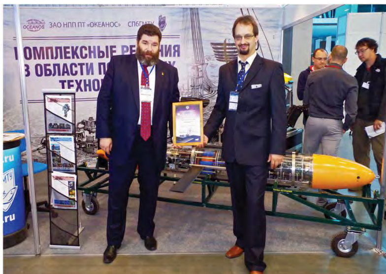
Рис. 4. Разработчики получают диплом конкурса инновационных разработок Министерства энергетики

лает их постоянное использование невозможным. Требуют устойчивого прямолинейного движения в период работы (что требует перехода на гибридную схему движения глайдера или увеличения скорости глайдера с использованием ГБО в момент прямолинейного движения по инерции).