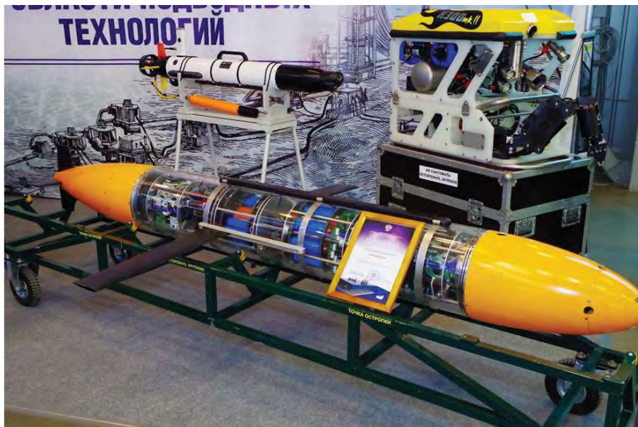
Рис. 6. Робототехнические средства ЗАО «НПП ПТ «Океанос» – глайдер, АНПА типа IVER2, ТПА типа Н300Мк2

Тем не менее, существуют пути решения всех этих проблем, и коллектив разработчиков уверен в возможности и необходимости создания семейства современных подводных робототехнических средств.