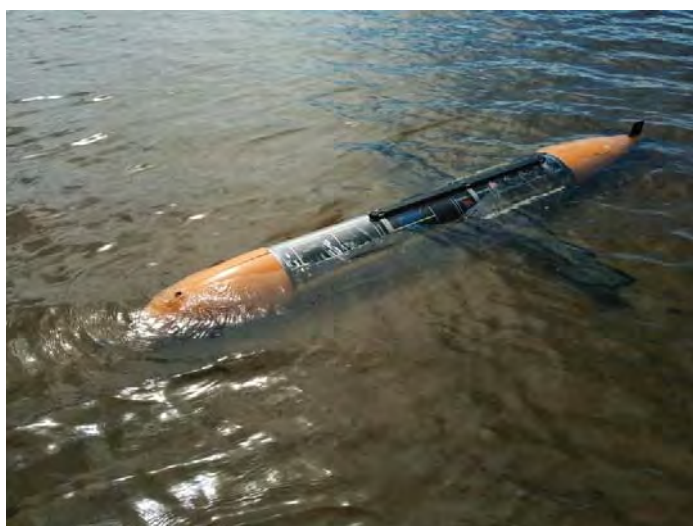
Рис. 3. Глайдер в ходе испытаний на открытой воде. Видны крылья и стабилизаторный блок.

Испытательные спуски проводились в контролируемой среде с минимизированными внешними возмущениями, с водолажным обеспечением и/или обеспечением ТПА с постоянным обязательным наличием дежурного плавсредства. Спуски проводились первоначально в режиме прямого управления, затем, после уточнения коэффициентов управляющих воздействий в САУ и логики алгоритмов – в автоматическом режиме. Вся телеметрия как передавалась на поверхность, так и записывалась на носитель (карту памяти) внутри аппарата, и воспроизводилась при дальнейшем анализе спуска.