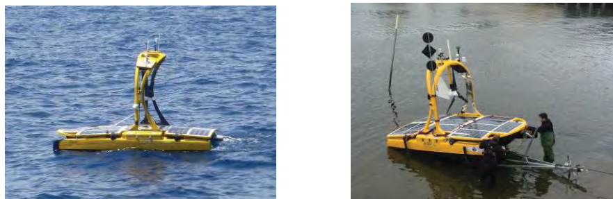
Рис. 7. Катамаран C-Enduro компании ASV

В плане использования возобновляемой энергии интересен опыт создания катамарана C-Enduro компании ASV Unmanned Marine Systems, рис. 7.