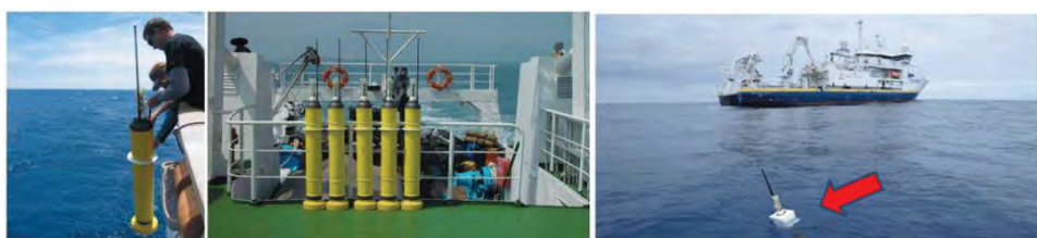
Рис. 1. Постановка автономных буев «Арго» с борта научно-исследовательского судна

Указанных недостатков лишены подводные глайдеры. Они могут самостоятельно выдвигаться к месту исследований, находиться в указанном районе и возвращаться к местам обслуживания, что позволяет использовать их многократно. Их автономность сопоставима с буюми проекта «Argo» и составляет до одного года за рабочий цикл, а с учетом многократного использования в течение жизненного цикла полезное время их использования превосходит время функционирования буя. Дискретность измерений может регулироваться в процессе выполнения исследовательской миссии.