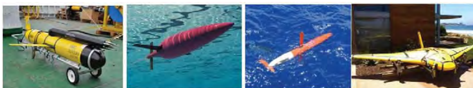
Рис. 2. Подводные глайдеры (Slocum, SeaGlider, Spray Glider, ZRay2)

Подводные глайдеры, появившиеся в начале 90-х годов прошлого века, наиболее распространены. Создано достаточно большое количество модификаций АНПА, серийно производимых в различных странах мира. Здесь, в первую очередь, необходимо упомянуть о разработках таких аппаратов, как Slocum, SeaGlider, Spray Glider, ANT Littoral Glider (Exocetus), Liberdade/ZRay, SeaExplorer, Folaga [2–8], рис. 2.