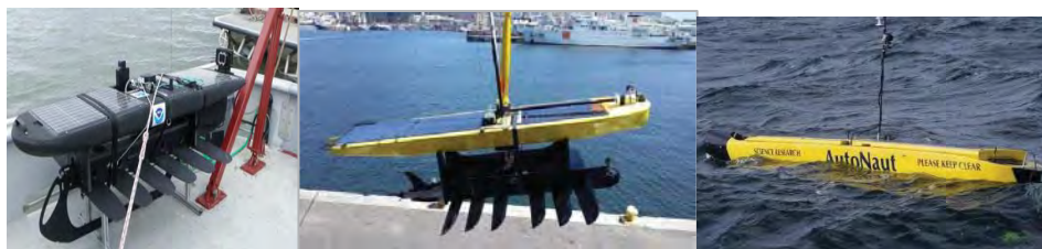
Рис. 6. Волновые глайдеры (LR SV2 series, LR SV3 series, AutoNaut)

Для длительной работы в качестве глайдера-носителя микроАНПА с учетом требований периодической подзарядки наиболее подходят волновые глайдеры. Этот тип глайдеров начал развиваться позже подводных и в настоящее время представлен лишь несколькими серийными платформами SV2 и SV3 компании Liquid Robotics, Inc., а также AutoNaut компании MOST AV Ltd [1, 8], рис. 6.