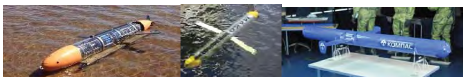
Рис. 3. Подводные глайдеры России (СПбГМТУ-ЗАО НПП «Океанос», СПбГМТУ-СамГТУ, КБ «Компас»)

Ведутся разработки глайдеров и в России. В 2011–2013 гг. СПбГМТУ совместно с Самарским ГТУ были разработаны первые российские опытные образцы подводного и волнового глайдеров. В 2014 г. СПбГМТУ совместно с ЗАО НПП ПТ «Океанос» разработан действующий макет подводного глайдера второго поколения [20–25]. В 2015 г. на выставке «Армия-2015» была представлена модель «Глайдер-Т» разработанная московским конструкторским бюро «Компас» [19] рис. 3.