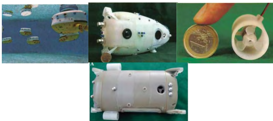
Рис. 4. Группа микроАНПА «Lily», микроАНПА «Jeff», двигатель микроАНПА «Jeff», микроАНПА «ANGEL»

Одной из последних разработок по использованию микроАНПА является работа австрийского университета Грац с участием специалистов Германии, Великобритании, Италии и Бельгии по созданию системы CoCoRo (Collective Cognitive Robots) [13]. Система представляет собой АНПА-носитель и группу мини-АНПА «Lily» и «Jeff» действующих по принципу рыбной стаи, рис. 4.