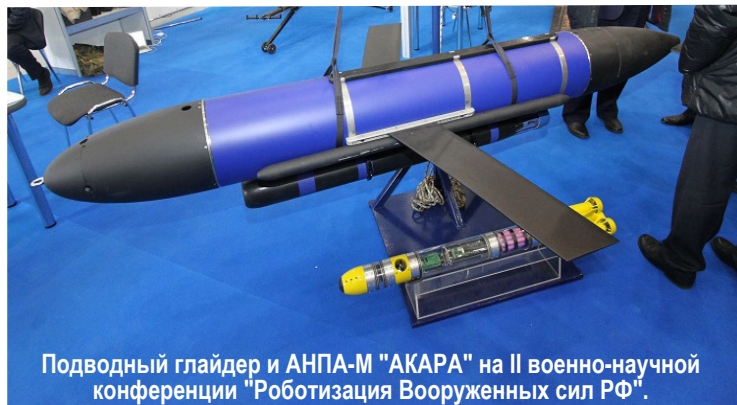
Подводный глайдер и АНПА-М "АКАРА" на II военно-научной конференции "Роботизация Вооруженных сил РФ".