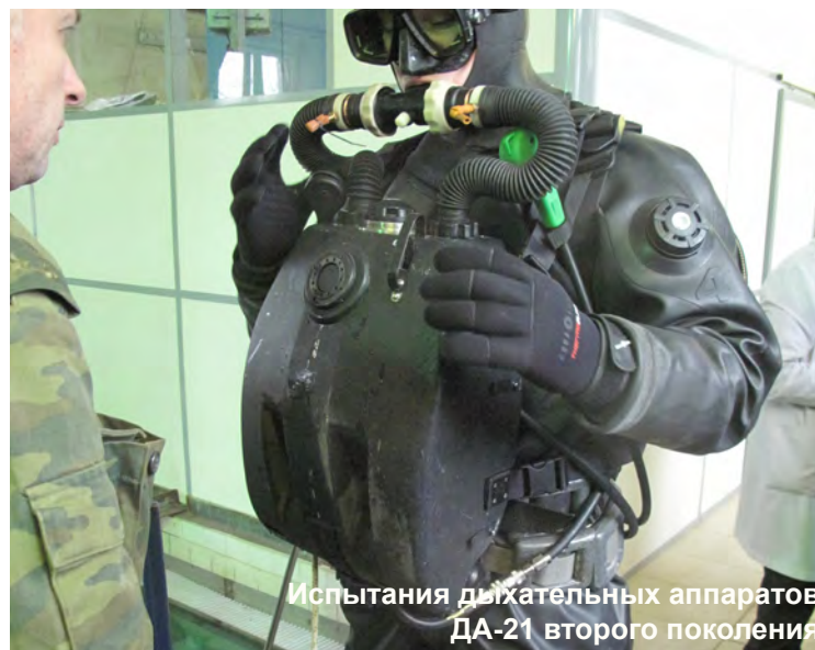
Испытания дыхательных аппаратов ДА-21 второго поколения