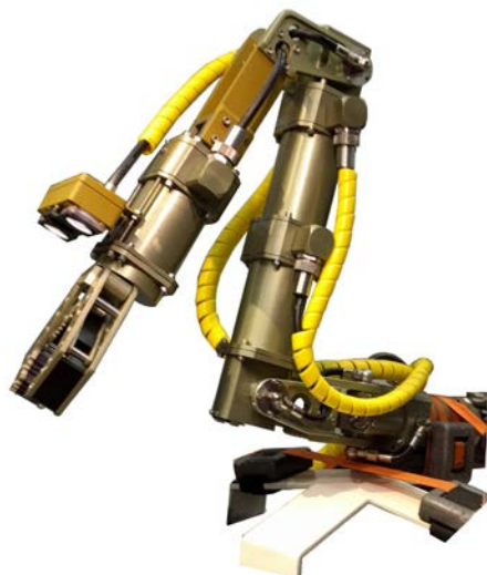
Стенд-манипулятор версии 2.1

для отработки алгоритмов системы управления (5 степеней свободы).