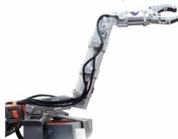
Стенд-манипулятор версии 2.0

для отработки алгоритмов системы управления (1-ая, 4-ая и 5-ая степени свободы).