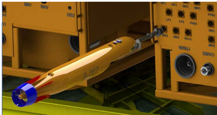
Концепт-проект СПбГМТУ и АО "НПП ПТ "ОКЕАНОС" АНПА с манипуляторным комплексом (на примере устьевой донной арматуры TechnipFMC)