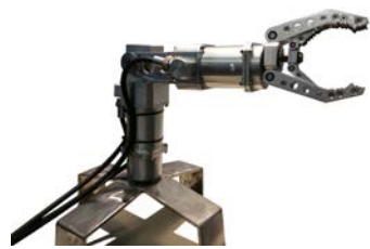
Стенд-манипулятор версии 1.0

для отработки алгоритмов системы управления (1-ая, 4-ая и 5-ая степени свободы).